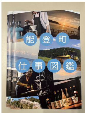
▲地域デザイン班が作成した仕事図鑑

このような暖かいご支援のおかげで、能登の高校生の学習環境を充実させることができます。この度ご支援・ご協力いただいたみなさま、本当にありがとうございます。