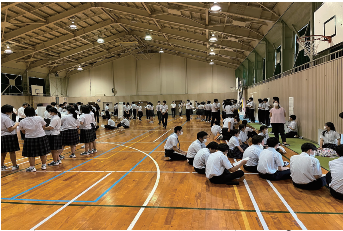
▲総合的な探究の時間 求人募集発表会の様子①