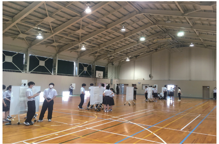
▲総合的な探究の時間 求人募集発表会の様子②